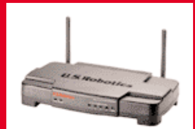
Wireless Turbo Access Point & Router – USR808054 modell

A U.S. Robotics 802.11g Wireless Turbo hálózatkezelési termékek teljes megoldást nyújtanak. Egyszerűen telepíthető készülékeink minden bizonnyal kielégítik sajátos hálózatépítési igényeit.