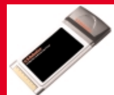
Wireless Turbo PC Card – USR805410 modell