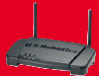
Wireless Turbo Multi-Function Access Point – USR805450 modell